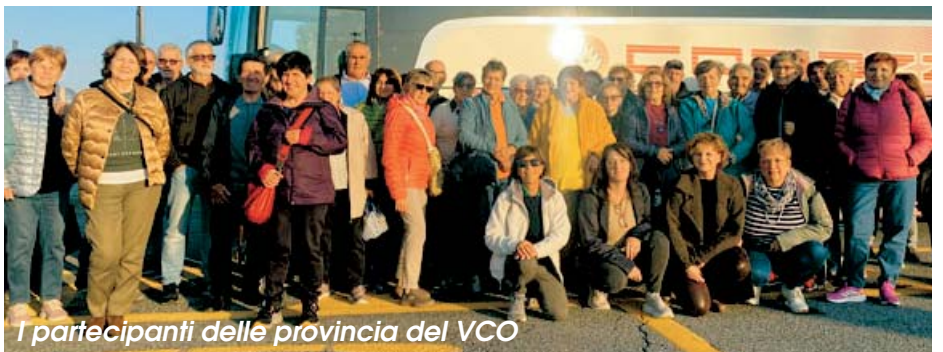
I partecipanti delle provincia del VCO

fermando quanto sia sentita la necessità di supporto digitale tra le persone anziane e il valore della socialità anche in questi contesti.