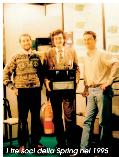
I tre soci della Spring nel 1995

A trent'anni dalla fondazione, l'impegno resta lo stesso: innova-