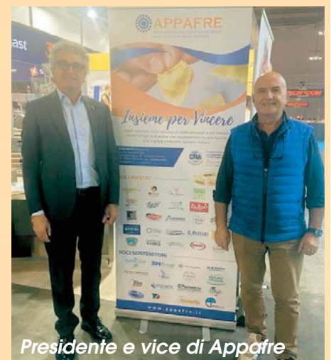
Presidente e vice di Appafre

sua pasta fresca ripiena, simbolo di qualità e saper fare artigiano.