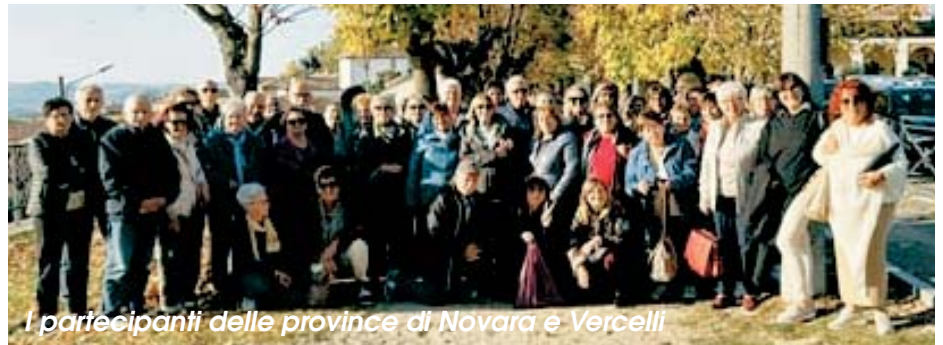
I partecipanti delle province di Novara e Vercelli

L'iniziativa ha riscosso grande interesse e partecipazione, con-