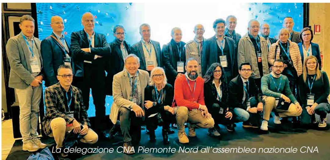
La delegazione CNA Piemonte Nord all'assemblea nazionale CNA

L'apertura, dopo l'inno nazionale eseguito da un originale coro, è stata caratterizzata dal saluto in video della presidente del consiglio Giorgia Meloni, la quale ha evidenziato l'importanza della collaborazione tra CNA e il governo, sottolineando il ruolo cruciale degli artigiani come spina dorsale dell'economia italiana.