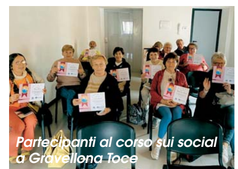
Partecipanti al corso sui social a Gravellona Toce