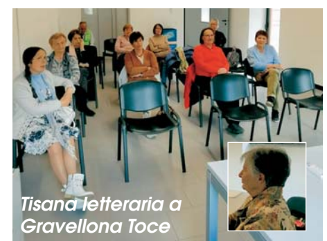
Tisana letteraria a Gravellona Toce